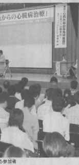
特別講演会を熱心に見る参加者

突然死は、一見健康そうに見える人が思わぬところで突然死すること。医学的には、心臓の電気的異常が原因で起こる。突然死は、一見健康そうに見える人が思わぬところで突然死すること。医学的には、心臓の電気的異常が原因で起こる。